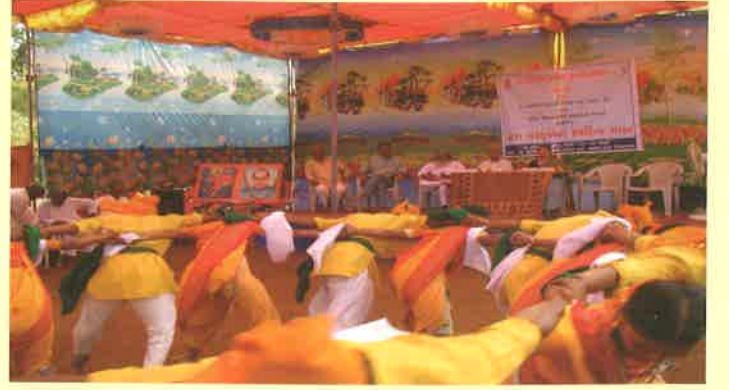
ડાંગ સંસ્કૃતિની સ્વર્ણિમ ગાથા