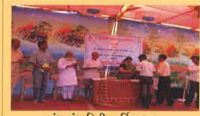
ડાંગ સંસ્કૃતિની સ્વર્ણિમ ગાથા

ડૉ. બાબાસાહેબ આંબેડકર મુક્ત વિશ્વવિદ્યાલય દ્વારા તા.29-10-2010ના રોજ ડૉ. આંબેડકર વનવાસી કલ્યાણ ટ્રસ્ટ આહવા-ડાંગ(સેવાધામ) ખાતે એક દિવસીય સ્વર્ણિમ ગુજરાત કાર્યક્રમ "ડાંગ સંસ્કૃતિની સ્વર્ણિમ ગાથા"નું આયોજન કરેલ હતું. જેમાં