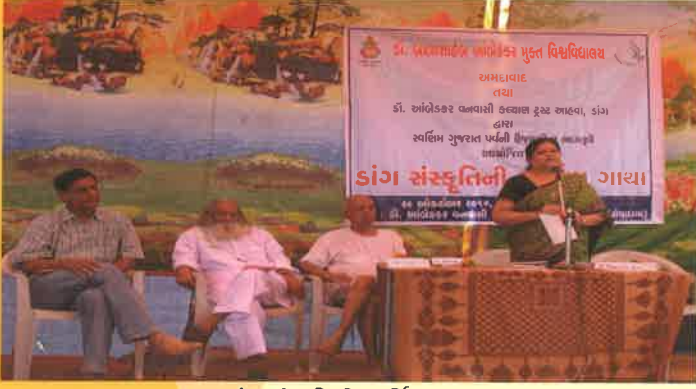
ડાંગ સંસ્કૃતિની સ્વર્ણિમ ગાથા