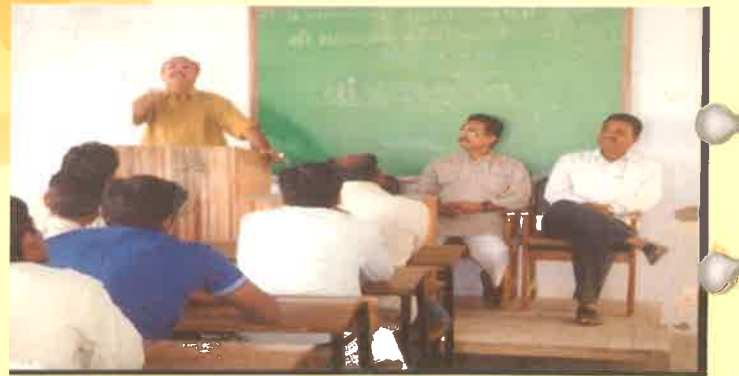
કેન્દ્રો ખાતે યોજાયેલ "એક સાથે વાંચો ગુજરાત" કાર્યક્રમ