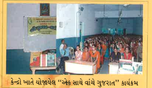
કેન્દ્રો ખાતે યોજાયેલ “એક સાથે વાંચે ગુજરાત” કાર્યક્રમ

શ્રી જી. એમ. બીલખિયા કોલેજ ઓફ આર્ટ્સ એન્ડ કોમર્સ કોલેજ, વંડામાં સંદર્ભગ્રંથોનું પ્રદર્શન યોજવામાં આવેલ. પુસ્તકોની માનવ જીવન પર અસર તેમજ વિદ્યાર્થીઓ દ્વારા પોતાને ગમતા પુસ્તકોના પરિચયનો આસ્વાદ કરવામાં આવ્યો અને પુસ્તકો વાંચવા જોઈએ એની છણાવટ કરીને સૌને વાંચવા પ્રેર્યા હતા.