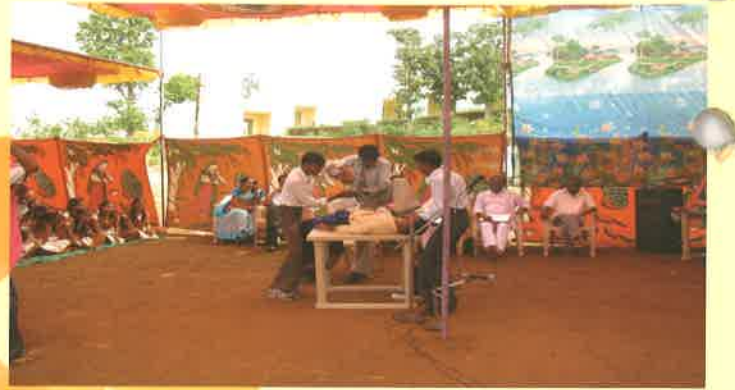
ડાંગ સંસ્કૃતિની સ્વર્ણિમ ગાથા