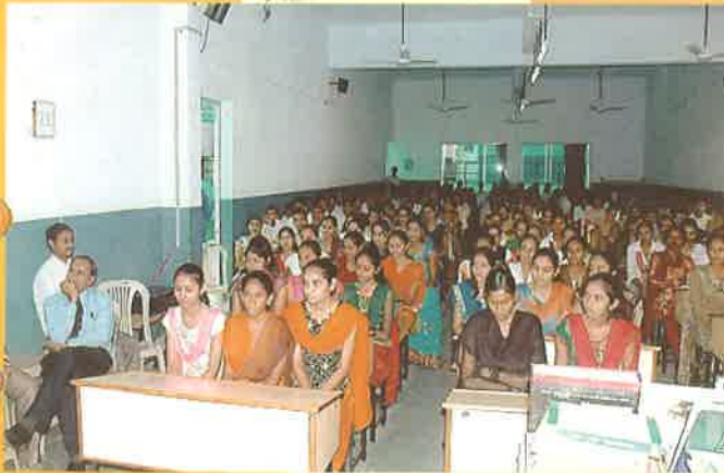
કેન્દ્રો ખાતે યોજાયેલ “એક સાથે વાંચે ગુજરાત” કાર્યક્રમ