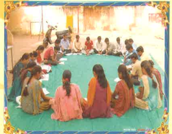
કેન્દ્રો ખાતે યોજાયેલ “એક સાથે વાંચે ગુજરાત” કાર્યક્રમ