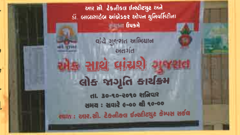
યુનિવર્સિટી ખાતે યોજાયેલ “એક સાથે વાંચે ગુજરાત” કાર્યક્રમ

આ કાર્યક્રમ દરમિયાન ગુજરાતી ભાષા, નવલકથા, કવિતા, જીવન ચરિત્ર, મેનેજમેન્ટ, ધર્મ, કોમ્પ્યુટર, કેરિયર ડેવલપમેન્ટ, જનરલ નોલેજ વિગેરે વિષયક પુસ્તકો તેમજ જુદાંજુદાં સામયિકો વાંચનના હેતુસર પસંદ કરવામાં આવ્યા હતા.