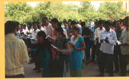
યુનિવર્સિટી ખાતે યોજાયેલ “એક સાથે વાંચે ગુજરાત” કાર્યક્રમ

આંબેડકર ઓપન યુનિવર્સિટી અને આર. સી. પ્રિન્સિપાલશ્રી, નિયામકશ્રી, વ્યાખ્યાતાશ્રીઓ, એક સાથે એક કલાકનું વાંચન કર્યું હતું. આ વાતાવરણ ઊભું થયું હતું તેમજ આ નવતર કારણે કર્મચારી અને વિદ્યાર્થીઓને પુસ્તકો તમામને વાંચન કરવા માટે ડૉ. બાબાસાહેબ