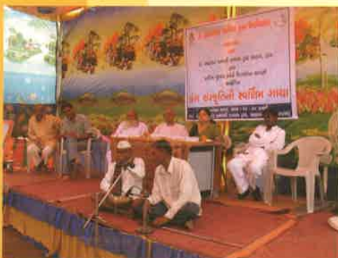
ડાંગ સંસ્કૃતિની સ્વર્ણિમ ગાથા