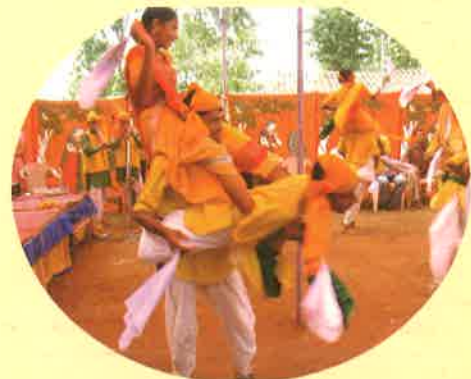
ડાંગ સંસ્કૃતિની સ્વર્ણિમ ગાથા