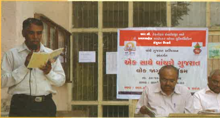
યુનિવર્સિટી ખાતે યોજાયેલ "એક સાથે વાંચો ગુજરાત" કાર્યક્રમ