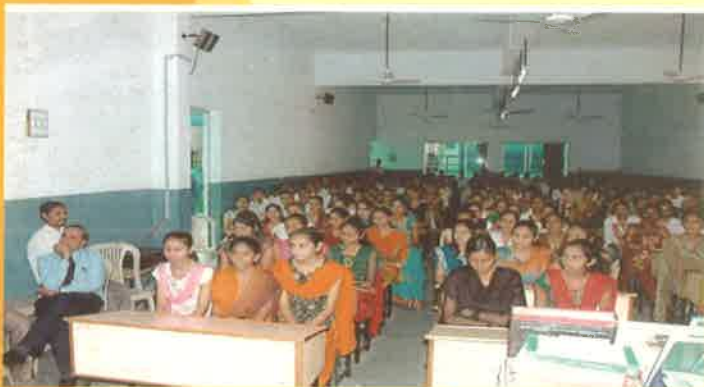
કેન્દ્રો ખાતે યોજાયેલ "એક સાથે વાંચો ગુજરાત" કાર્યક્રમ