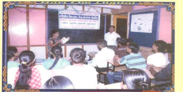
કેન્દ્રો ખાતે યોજાયેલ "એક સાથે વાંચો ગુજરાત" કાર્યક્રમ