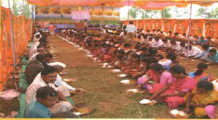
ડાંગ સંસ્કૃતિની સ્વર્ણિમ ગાથા