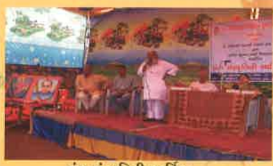
ડાંગ સંસ્કૃતિની સ્વર્ણિમ ગાથા

ડાંગ સંસ્કૃતિની સ્વર્ણિમ ગાથા દ્વારા ડાંગ જિલ્લાનાં અનેકવિધ મૂળ વતનીઓને આ કાર્યક્રમ દ્વારા સ્વર્ણિમ ગુજરાત કાર્યક્રમનો સંદેશો પહોંચે તે હેતુને ધ્યાનમાં રાખીને આ કાર્યક્રમનું આયોજન કરવામાં આવ્યું હતું. સદર કાર્યક્રમમાં સ્વર્ણિમ ગુજરાતને સંદેશ પાઠવતા શેરી નાટક સ્પર્ધા, વારલી ચિત્ર સ્પર્ધા અને ડાંગ જિલ્લાની આગવી પ્રખ્યાત સંસ્કૃતિના નૃત્ય જેમ કે ડાંગી નૃત્ય, ઠાકરે નૃત્ય, થાળાવાદ, પાવરી નૃત્ય વગેરેનું ગઠમંથન કરવામાં આવ્યું હતું. આ કાર્યક્રમની શ્રેષ્ઠતાની નોંધ ત્યાંના દૈનિક સમાચાર પત્રો સંદેશ તા.31-10-2010 અને