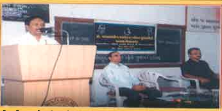
કેન્દ્રો ખાતે યોજાયેલ “એક સાથે વાંચે ગુજરાત” કાર્યક્રમ