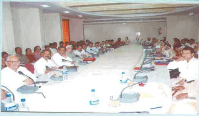
સભાગૃહમાં ઉપસ્થિત વિવિધ વિષયોના રાષ્ટ્રભરમાંથી આવેલા તજજ્ઞો અને શ્રોતાગણ

સેમિનારની યથાર્થતા પ્રસ્તુત કરવા તેઓએ ઉપસ્થિત દરેક તજજ્ઞો સમક્ષ ભારતની વિવિધ આલોચન પરંપરાઓ જેમ કે ગુજરાતી, હિન્દી અને સંસ્કૃત આલોચન પરંપરા અંગે નવા પરિમાણો નક્કી કરવા અપેક્ષા રાખેલ.