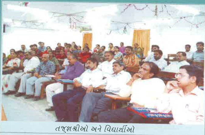
તજ્જશ્રીઓ અને વિદ્યાર્થીઓ