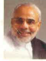
માન. મુખ્યમંત્રી શ્રી નરેન્દ્ર મોદી