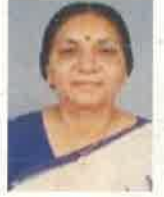
માન. શિક્ષણમંત્રી શ્રીમતી આનંદીબેન પટેલ