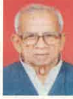
માન. રાજયપાલ શ્રી કેલાસપતિ મિશ્ર