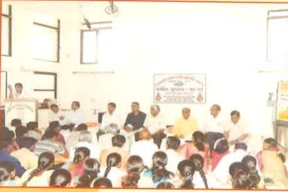
સ્વર્ણિમગુજરાત પદ્ય-પર્વની ઉજવણી: સેન્ટર- ૧૦૦૨