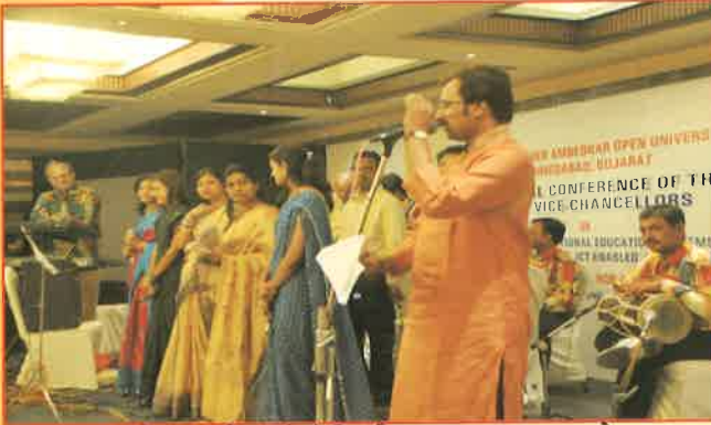
સંચિકા કાર્યક્રમમાં સંગીત-ચિત્ર કાવ્ય સમન્વય સાથે કવિતાનું પઠન કરતાં કવિશ્રી