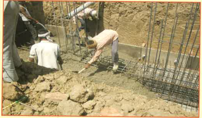
યુનિવર્સિટી ભવન બાંધકામની કામગીરી