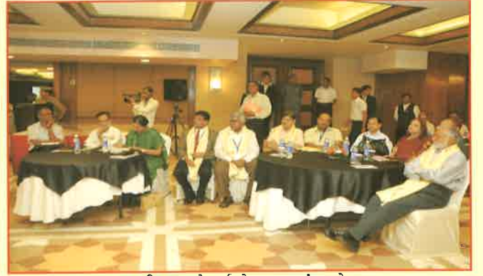
વાઈસ ચાન્સેલર્સ કોન્ફરન્સમાં આવેલ ભારતભરના માન.કુલપતિશ્રીઓ