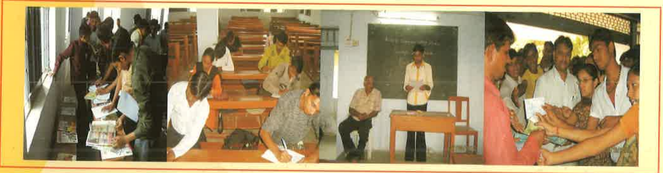
પુસ્તક મેળો, નિબંધ સ્પર્ધા, બુક રીવ્યુ અને મફત પુસ્તિકા વિતરણ કાર્યક્રમ