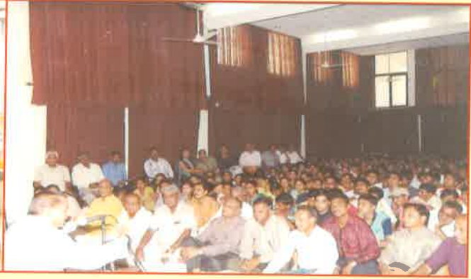
કવિ, શાયરો સાહિત્યકારો અને શ્રોતાગણ