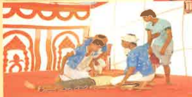
દાહોદ સંસ્કૃતિનું સ્વર્ણિમ ગાથા