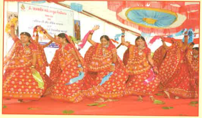
દાહોદ જિલ્લાની સ્વર્ણિમ ગાથા : આદિવાસી નૃત્ય