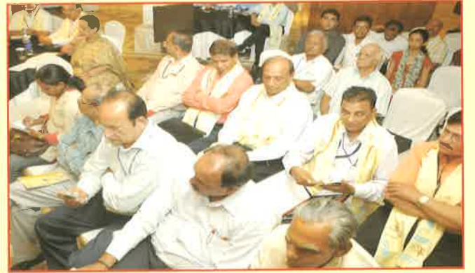
વાઈસ ચાન્સેલર્સ કોન્ફરન્સમાં આવેલ ભારતભરના માન.કુલપતિશ્રીઓ અને શ્રોતાગણ