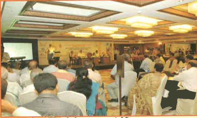
વાઈસ ચાન્સેલર્સ કોન્ફરન્સમાં પ્રસંગોચિત વક્તવ્ય આપતા માન.મુખ્યમંત્રીશ્રી નરેન્દ્રભાઈ મોદી