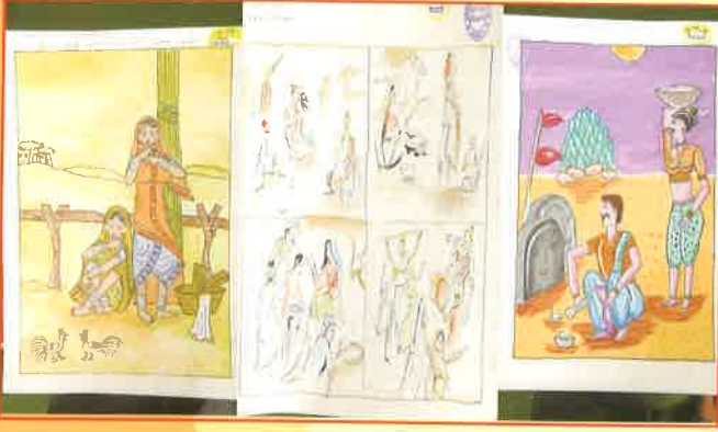
દાહોદ જિલ્લાની સ્વર્ણિમ ગાથા: ચિત્ર સ્પર્ધા